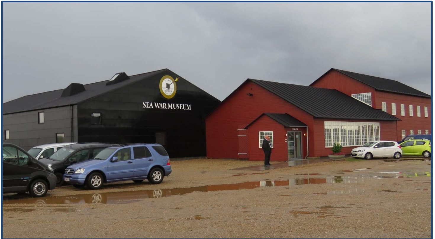
Foto fra indvielsen af museet d. 11. september 2015

Museet omhandler søkrigen under 1. verdenskrig og der udstilles tårne fra u-både, kanoner, torpedoer og miner samt mange forskellige effekter og dokumentation.