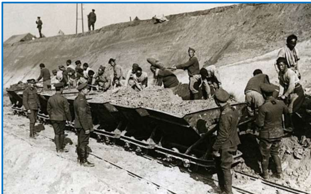
CLC-kommando i gang med et anlægsarbejde

Da nyheden om et oprør blandt de engelske arbejdere nåede kineserne og nogle egyptiske arbejdere i Boulogne, gik de i strejke som protest mod deres arbejdsforhold, den dårlige mad, den dårlige behandling og risikoen for at blive bombet af tyskerne. Mændene tog ind til byen og forsøgte at plyndre et hotel, men blev drevet væk. Så angreb de en klub, hvor hærens officerer kom, men så åbnede soldater ild og dræbte og sårede et større antal, ligesom nogle blev arresteret.