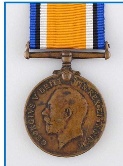
The British War Medal i bronze