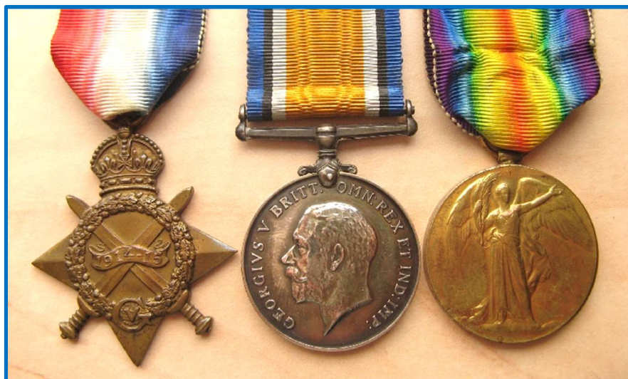
1914-1918 Star - The British War Medal - Victory Medal

For et par år siden så jeg en BWM til salg, men i bronze. Det lykkedes mig at erhverve den og kunne så se, at randteksten kun var "CLC" og et nummer. Jeg fandt også ud af, at der kun er uddelt 110.000 stykker og de alle er givet til personer, der var i CLC.