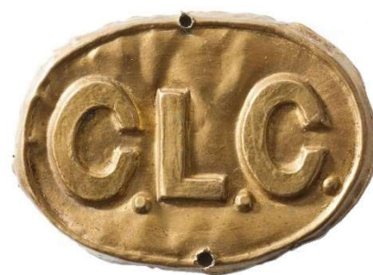
Det prægede metalmærke, der blev båret på kinesernes filthuer. På fotoet til venstre ses mærket på flere af huerne

Mændene fik tre måltider om dagen, som inkluderede ris, grøntsager, fisk og to gange om ugen var der kød alt sammen suppleret med masser af te. Dette samt det gratis tøj, der for langt de flestes vedkommende, var bedre end noget de tidligere havde haft, gjorde et godt indtryk på mændene, og fik dem til at føle sig godt tilpas.