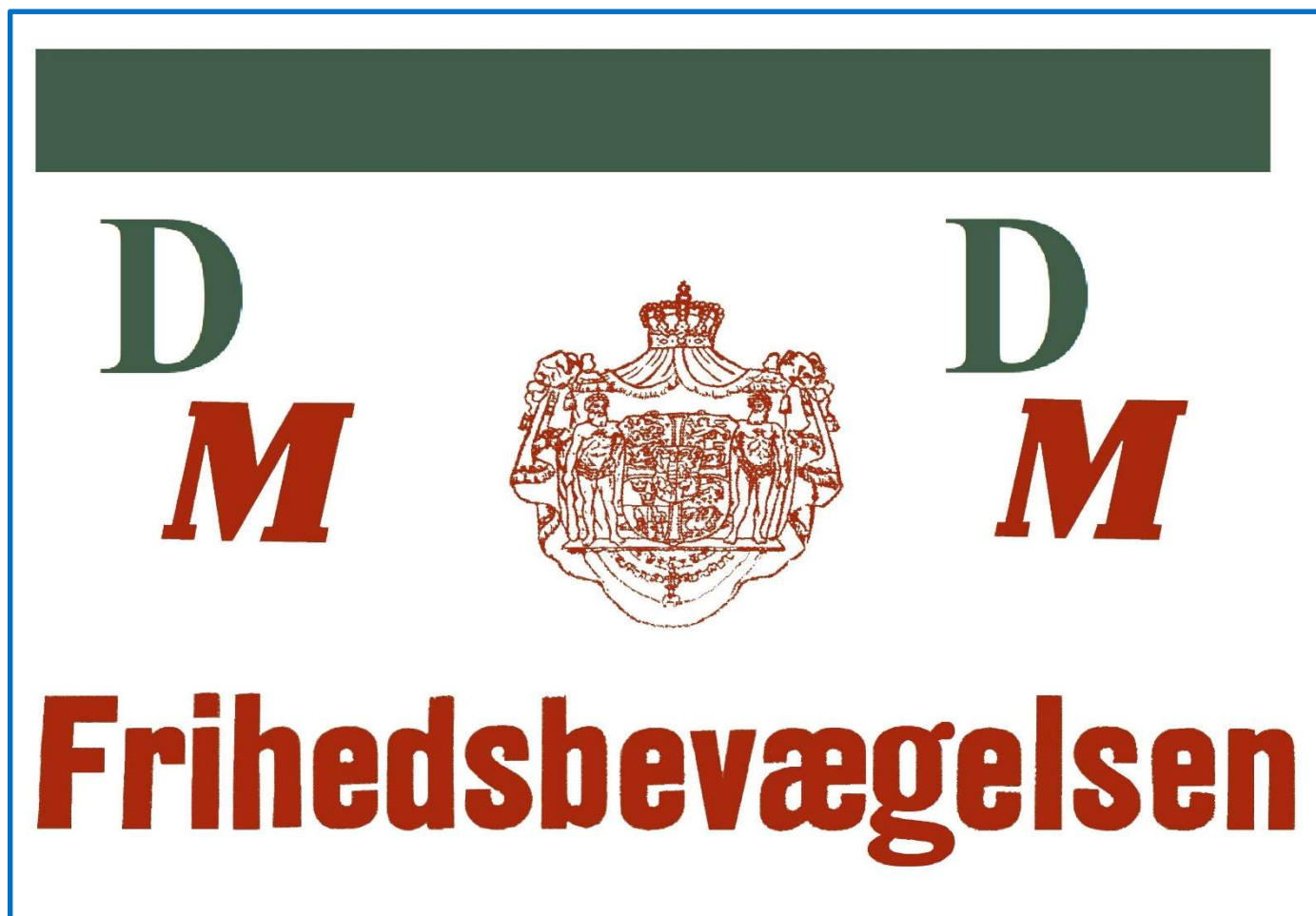
Illustration af et delingsførerarmbind

Det var uden tvivl godt for Modstandsbevægelsen omdømme, at de ikke gjorde, som tyskerne gjorde i Frankrig og Tjekkosllovakiet, hvor de lukkede landsby befolkning inde i kirker og brændte dem af.