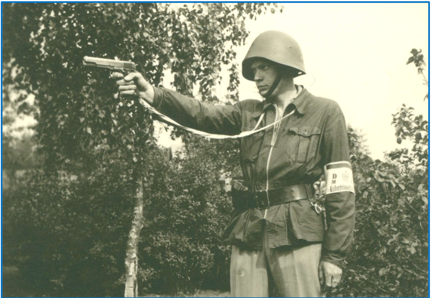
En stålsat modstandsmand på skydeøvelse med Delingsfører-armbindet på venstre arm