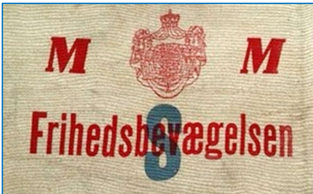
Til sammenligning et foto af et af sabotagegruppernes armbind