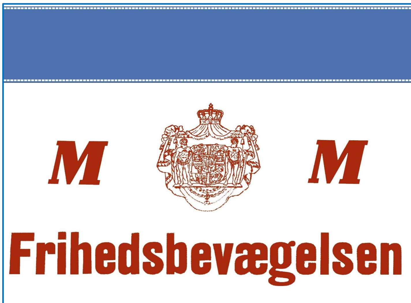
Illustration af et af nedkastningsgruppernes armbind med det ekstra blå bånd