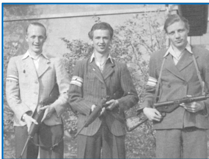
Fotos fra Inger Hansens bog hvor modstandsarmbindet bæres om højre arm

Jeg har ikke observeret det ved andre byer, at modstandsgrupper optræder med armbindet om højre arm. Men det forekommer på flere billeder fra Tarm. Billederne her er nok taget den 5. maj, for alle har det lokale armbind på. Hvis der er nogen, der har en forklaring på, hvorfor armbind normalt bæres på venstre arm, så hører jeg gerne herom. Det er ikke kun i Danmark, man gør det, men også i udlandet.